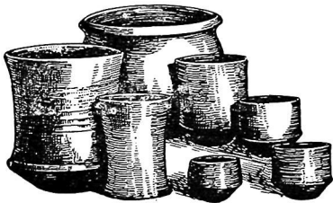
Образцы керамики V в. до н. э., выявленные при археологических раскопках на территории Самарканда.

Значительной серией представлены небольшие нуклеусы поддисковидной формы, одноплощадочные призматические нуклеусы со снятием тонких пластин, нуклеусы в виде конуса, а также скребочки—боковые,