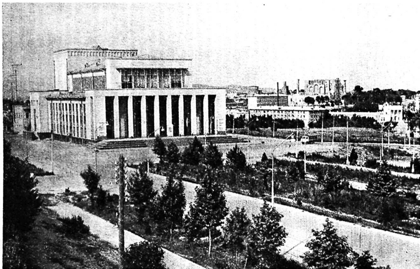
Геатральная площадь в Самарканде.