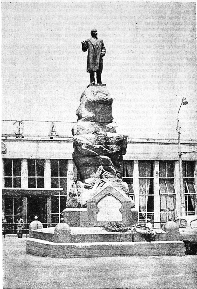
Самарканд. Привокзальная площадь. Памятник В. И. Ленину.