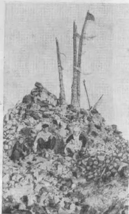
Рис. 5. Святилище Мураджат (горы Султан-Уиздаг)

На каждое камлание собирается до 15—20 женщин, судя по отзывам которых воздействие шаманов на психику присутствующих весьма значительно 5 .