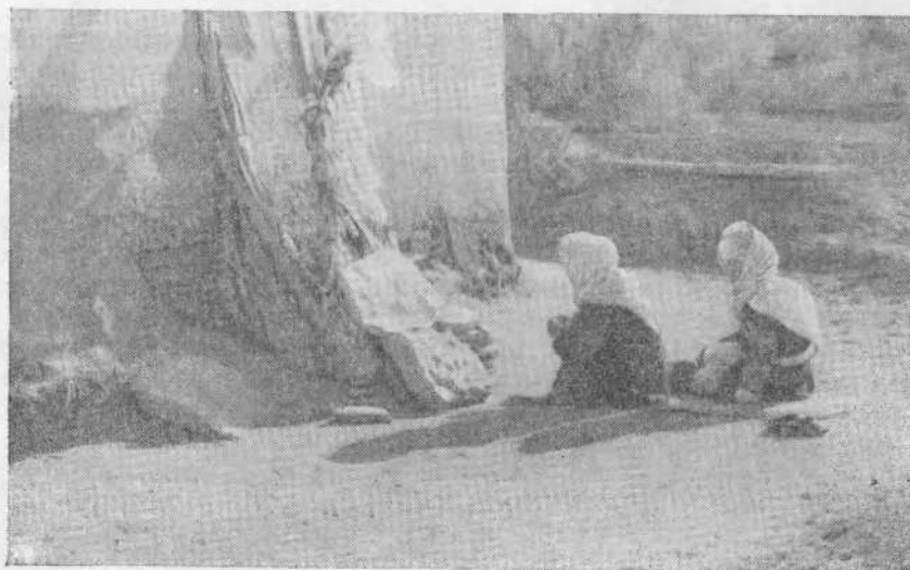
Рис. 1. Паломницы возле мазара Кара-Капы (Куня-Ургенч).

Это понятно. Чем сильнее было экономическое и политическое значение ислама в условиях среднеазиатских ханств, его влияние на правовые