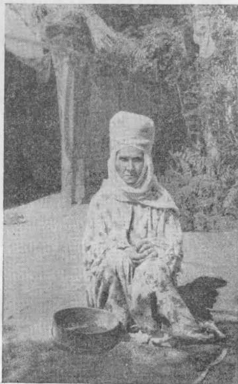
Рис. 2. Повитуха «момо». (гор. Ханки)

Обращает на себя внимание то обстоятельство, что никах стремятся совершить при минимальном числе свидетелей, тайно, когда все разойдется или даже через несколько дней после свадебного тоя. Допускаются только близкие люди. На дворе, около окон, на крыше, у ворот стоят своего рода пикеты из родных и знакомых.