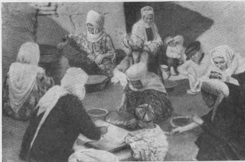
Рис. 6. Женщины готовят ритуальное печенье «баурсак» около могилы «святого» (гор. Ханки)

Упомянутые пережитки и многие другие, на которых мы сейчас не останавливаемся, коренятся в быту женщин по ряду причин. Немалое значение здесь имеют известная культурная отсталость женской части населения и недостаточность культурно-воспитательной работы в этой среде. Однако основную причину следует искать в исторически сложившейся изоляции женского быта, следы которой мы находим и по сей час,