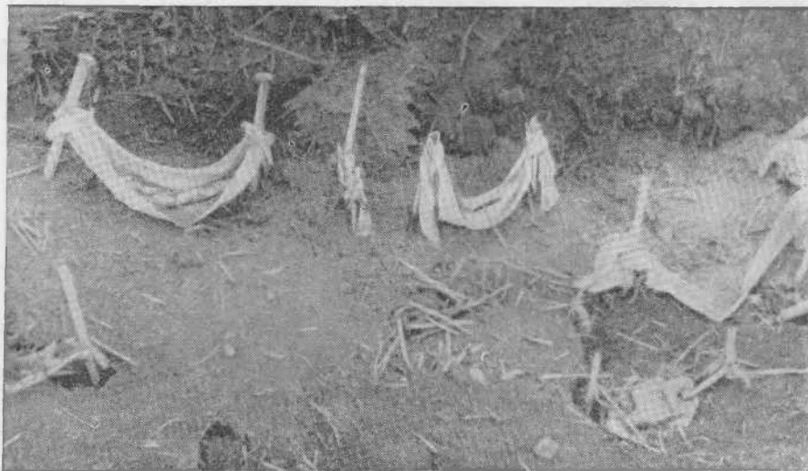
Рис. 3. Имитация детских колыбелей «бешик»; их расставляют у мазара бездетные женщины, чтобы испросить себе у «святого» потомство (Куныя-Ургенч).

Казалось бы, здесь мы имеем дело с обстановкой, созданной для того, чтобы сохранить в тайне от окружающих религиозный обряд, участие муллы, что в современных условиях может скомпрометировать жениха, невесту, их родителей в глазах общественности. Однако выяснение причин этого явления показало, что указанные меры предосторожности весьма далеки от подобных мотивов, а вызываются исключительно боязнью