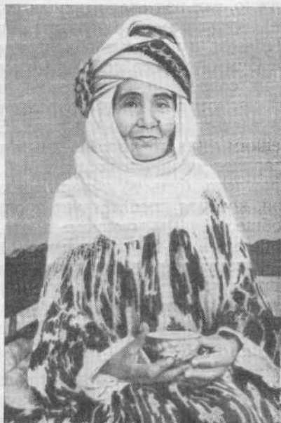
Рис. 7. «Ходым» в церемониальной одежде (гор. Ханки)

Элаты следует рассматривать как реликтовую форму сельской общины, которая в условиях Средней Азии сохраняла в прошлом архаические черты, восходящие к древним родовым традициям.