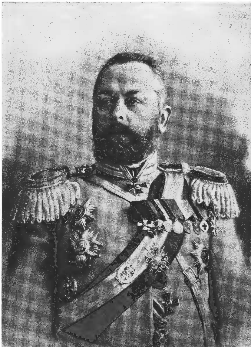
Генералъ А. В. Самсоновъ.